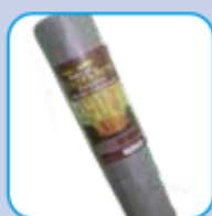
Feutre anti-racine Root control fabric